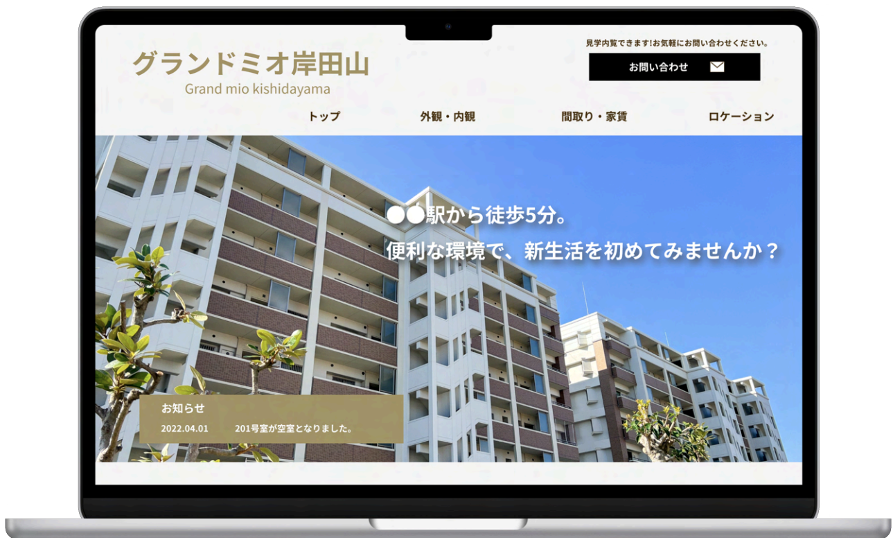
target blankのホームページ制作イメージ

写真撮影等の出張につきましては、遠方の場合には別途出張費を頂戴する場合や、出張をお断りする場合がございます。